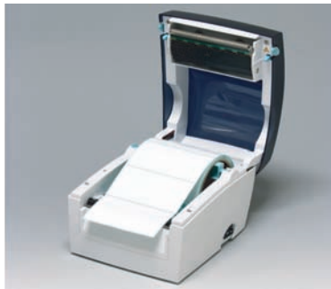
●ラベルセットが簡単なフルオープン機能