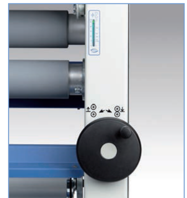
■高さゲージによる正確なオペレーション