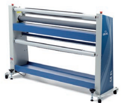
※巻き取り装置はオプションです(開発中)

なっており、メンテナンスも簡単。サイン業界で支持の高いSEAL社がお送りする54ELはワイドフォーマットへの最初の一台にピッタリといえるでしょう。