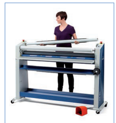
■女性でも扱いやすい設計