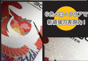
6色+白+クリアで新領域の表現力!

※LF-200、LF-140の延伸性能はプリントする素材により異なります。必ず事前に試験をお願いします。 ※LF-140にはクリアインクがありませんが、LF-100のクリアインクを組み合わせることで使用することができます。