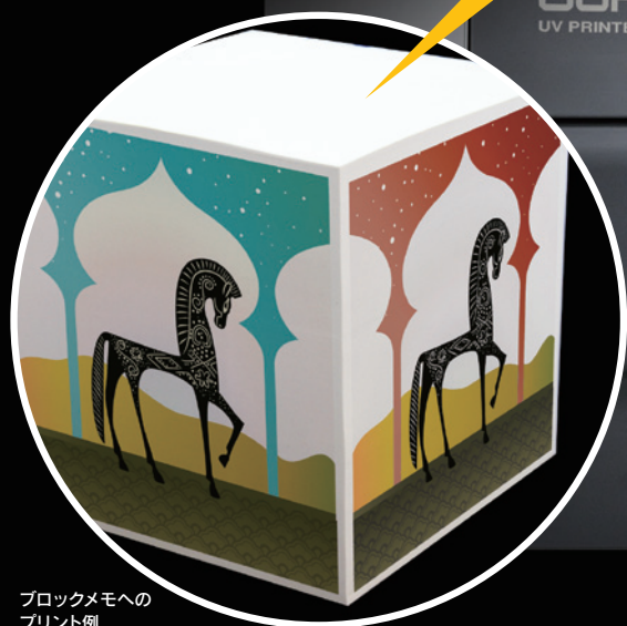
ブロックメモへの プリント例