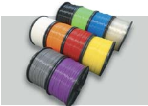
多彩なカラーフィラメント

「MF-2000」は、ヘッドを 2 個搭載しており、異種材を使用しての出力も可能です。また、ダブルヘッド搭載機の多くで発生する、積層中にヘッドが造形物にぶつかる問題を、未使用側のヘッドを回避させることで解決しました。