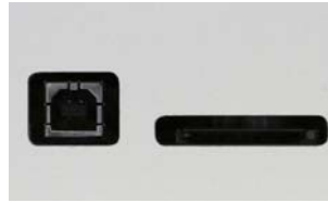
USBコネクタ・SDカードスロット