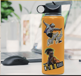
ラベル・ステッカー