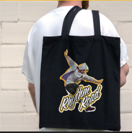
オリジナルトートバッグ