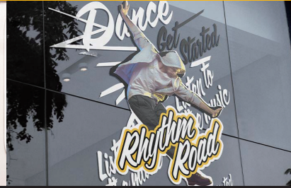
ウィンドウグラフィック