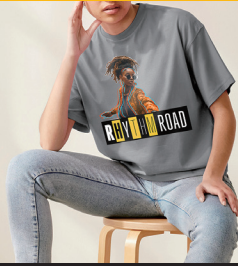
オリジナルTシャツ